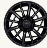
001 FR Edition R22" Forjado aligerado "FR"