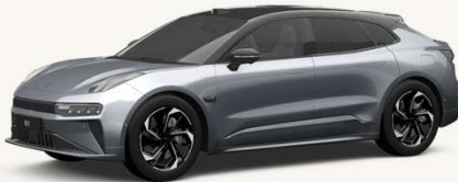
001 Gris Tecno