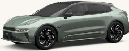
001 Verde Cuarzo** **Solo en Flagship AWD