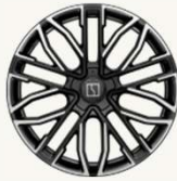
001 Flagship AWD R22" Forjado multi-radio, acabado bitono