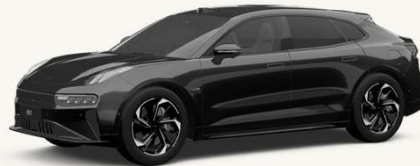
001 Negro Phantom