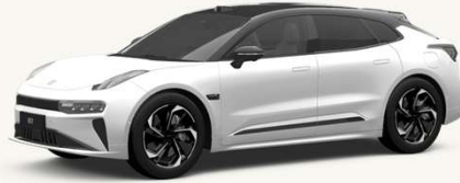
001 Blanco Cristal** **Solo en Flagship AWD