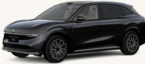
7X Negro Phantom