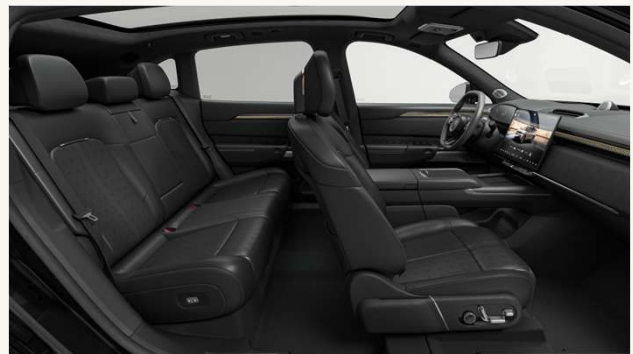
7X Premium, 7X Flagship Tapicería microperforada en cuero Nappa negro, de grano fino