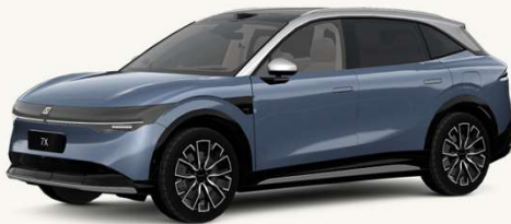
7X Azul Egeo/Techo Gris** ** No disponible en versión Sport