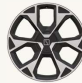
7X Flagship R21" Forjado, acabado bitono