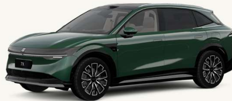
7X Verde Selva