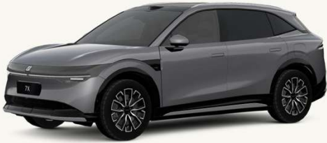
7X Gris Tecno