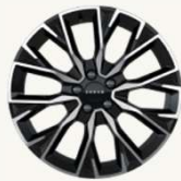
7X Sport, 7X Premium R19" Multi-radio, acabado bitono