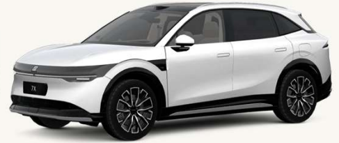
7X Blanco Cristal