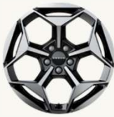
X Sport R18" Cinco radios, acabado bitono