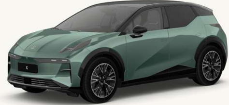
X Flagship AWD 2026

Techo y spoiler trasero en color contraste a la carrocería