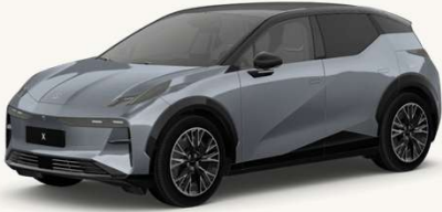
X Gris Metal