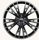
X Flagship R20" Forjado multi-radio, acabado bitono