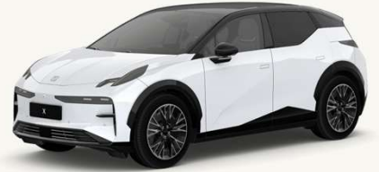
X Blanco Cristal