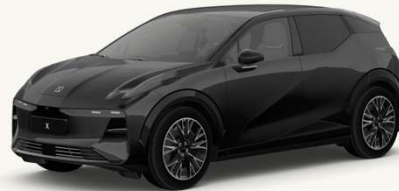
X Negro Phantom Bajo pedido, únicamente en Flagship