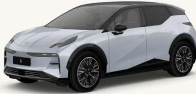
X Gris Neblina