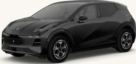
X Sport RWD 2026

Motorización Motor eléctrico síncrono en el eje trasero