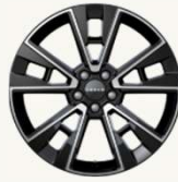
X Premium R19" Cinco radios dobles, acabado bitono