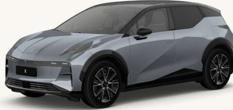
X Premium RWD 2026

Modo Centinela – Vigilancia continua mediante sistema DVR.