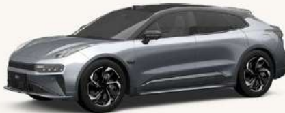
001 Gris Tecno