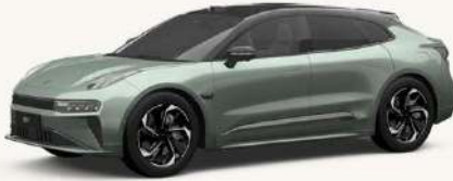
001 Verde Cuarzo** **Solo en Flagship AWD