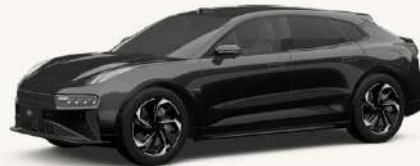
001 Negro Phantom