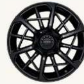
001 FR Edition R22" Forjado aligerado "FR"