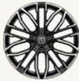
001 Flagship AWD R22" Forjado multi-radio, acabado bitono