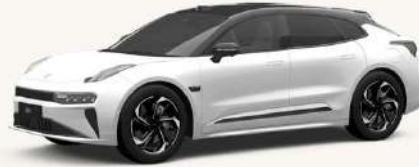
001 Blanco Cristal** **Solo en Flagship AWD