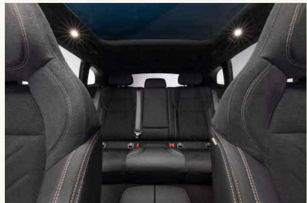
001 Flagship AWD, 001 FR Edition Tapicería en cuero vegano negro, en combinación con microfibra y costuras deportivas en contraste