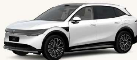
7X Blanco Cristal