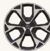
7X Flagship R21" Forjado, acabado bitono