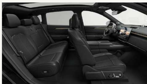
7X Premium, 7X Flagship Tapicería microperforada en cuero Nappa negro, de grano fino