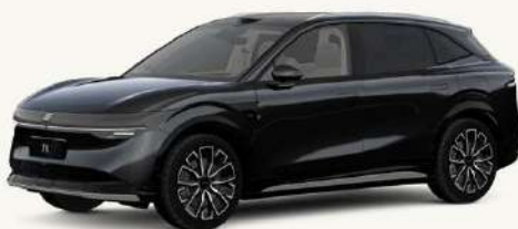
7X Negro Phantom