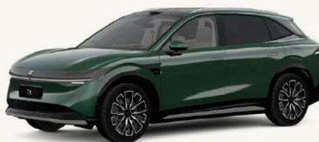
7X Verde Selva