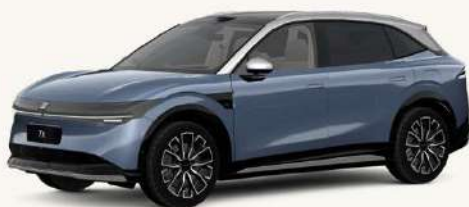
7X Azul Egeo/Techo Gris** ** No disponible en versión Sport