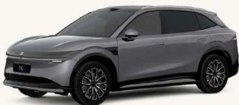
7X Gris Tecno