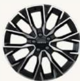
7X Sport, 7X Premium R19" Multi-radio, acabado bitono